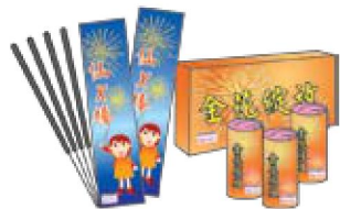
手持火花 筒狀火花